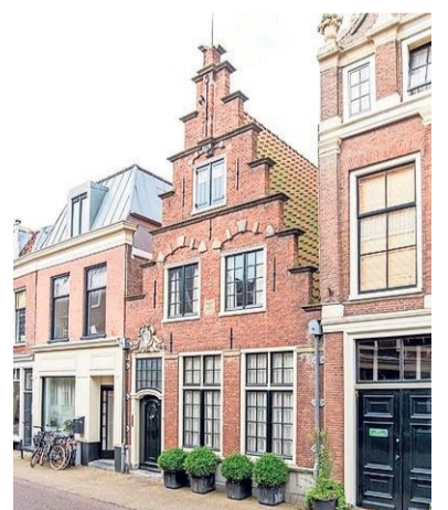
Het pand aan de Kleine Houtstraat.